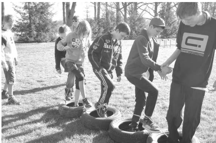
Astotie veiksmīgi dodas savā „Izlūgājienā”