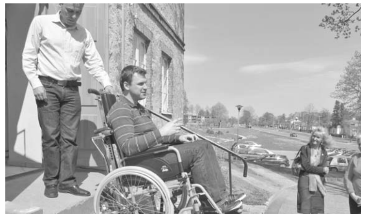
Tiek demonstrēts pacēlājs praktiskā darbībā

Mobilais pacēlājs tika izmēģināts arī praktiskā darbībā dzīvojamā mājā, lai pārliecinātos, kā cilvēks ratiņkrēslā no trešā stāva var nokļūt lejā pa kāpnēm uz ielas. Daudzi no kustību invalīdiem ilgāku laiku vispār nav tikuši ārpus sava dzīvokļa sienām, bet mobilais pacēlājs piedāvā daudz iespēju - nokļūt pie ārsta, uz iestādēm, vai vienkārši aizbraukt līdz dārzam, vai paskatīties, kādi tagad Priekuļi izskatās. Pacēlājs cilvēku ratiņkrēslā noved pa kāpnēm, pavadotā persona, kurai obligāti jābūt apmācītai darboties ar ierīci, atbrīvo ratiņkrēslu no pacēlāja, kur tas bija droši un stingri piestiprināts, un cilvēks savā ratiņkrēslā var doties savās gaitās. Atgriežoties mājās, persona, kas darbojas ar pacēlāju, atkal cilvēku ratiņkrēslā sagaida un nogādā atpakaļ dzīvoklī.