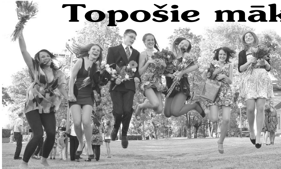
Mākslas skolas Priekuļu absolventi priecīgi par saņemtajiem diplomiem