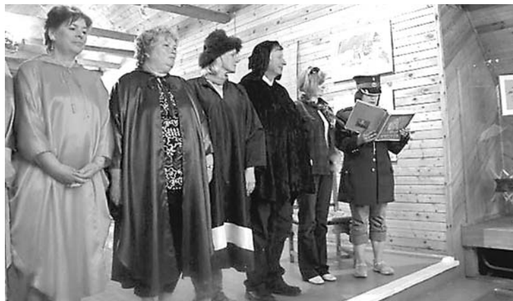
A. Pumpura muzejā Lielvārdē